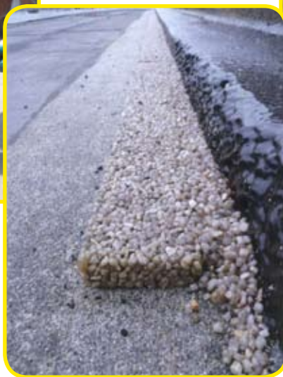
1/25 quartz 4-8