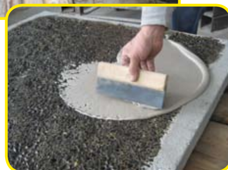
1/3 charge CL 1