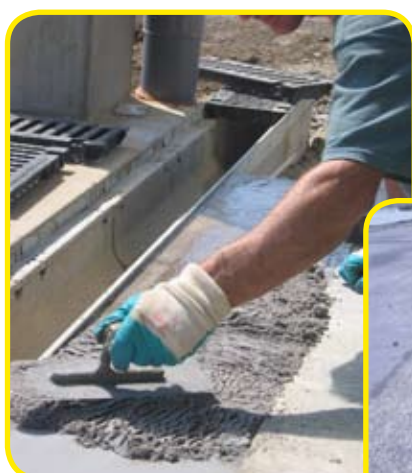
1/9 charge 1135